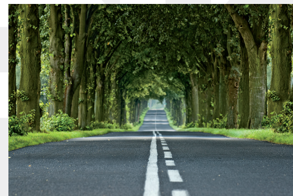
Bildunterschrift sollten in min. 7 pt geschrieben werden.

gia finis. Est vetus atque probus, centum qui perficit annos. Quid, qui deperiitnihilis perfectos uno mense vel anno?